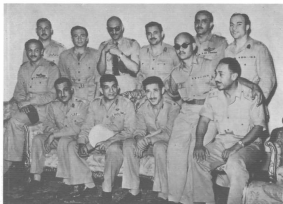
مجلس قيادة الثورة مع محمد نجيب